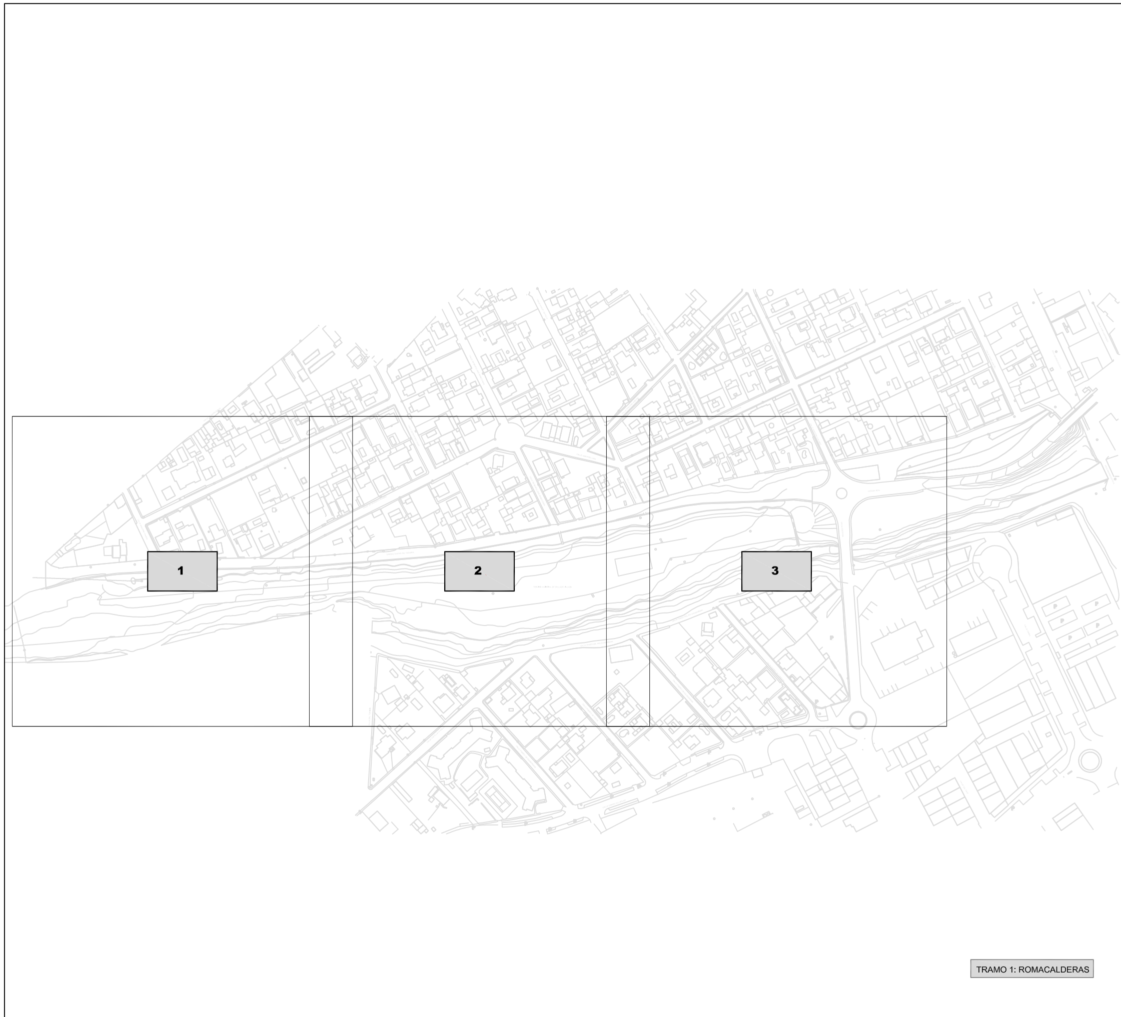
TRAMO 1: ROMACALDERAS